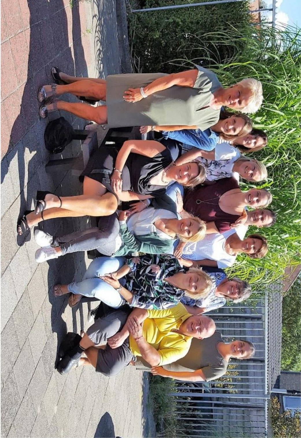
Team de Lispeltuut 2018 - 2019