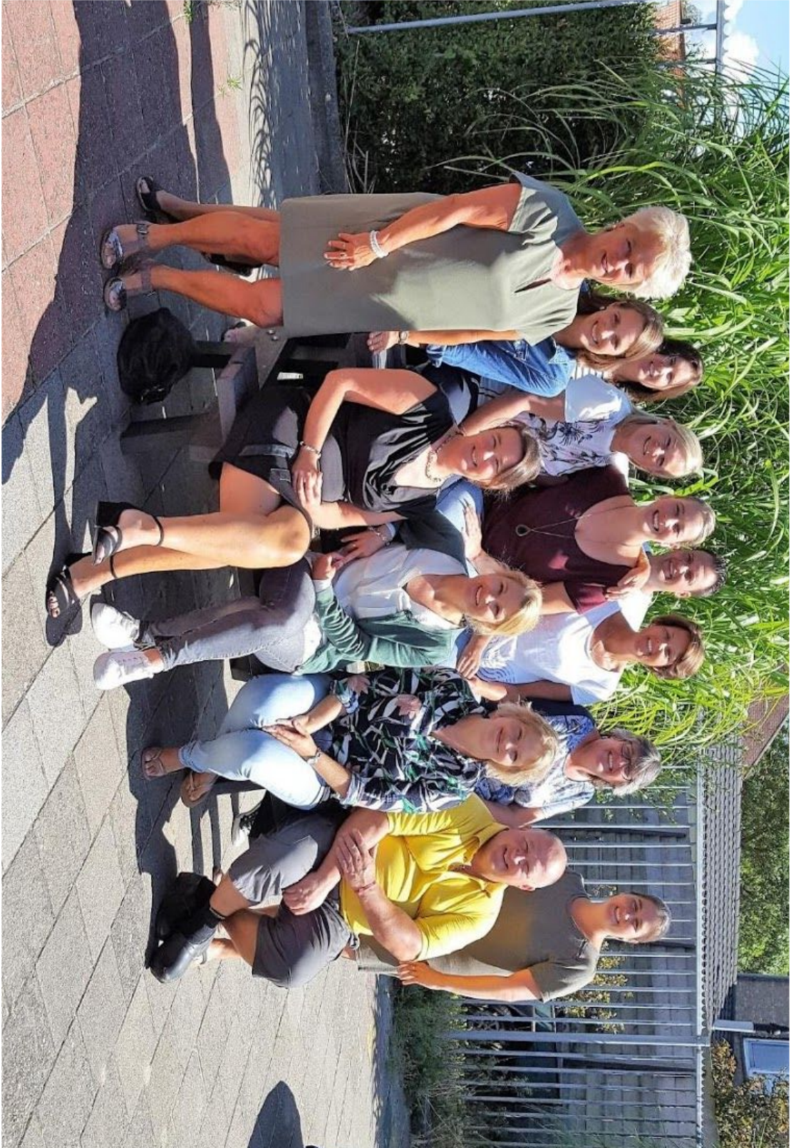
Team de Lispeltuut 2018 - 2019